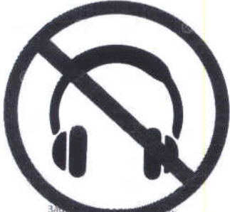
Запрещается прослушивание любого медиаконтента (музыка, радио, видео и т.п.)