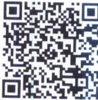
Берегись поезда Safetrain