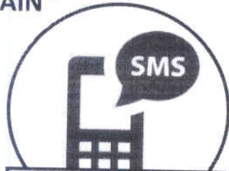
СМС информирование родителей: - попадание в опасную зону; - отключение геолокации; - отключение приложения.